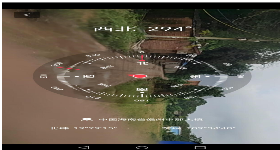
事发现场外部道路